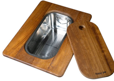
Planche de découpe Twin en bois Iroko avec tamis en acier inoxydable

* uniquement en combinaison avec l'accessoire 8644 101